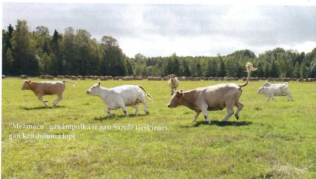
"Mežmaču" ganāmpulkā ir gan Šarolē tīršķirnes, gan krustojuma lopi

- Par līdzīgām iecerēm dzirdēts daudzviet Latvijā, tomēr joprojām šāda sadarbība, kooperatīvi, veidojas ļoti gausi un negribīgi. Kas varētu būt bremzējošais faktors?