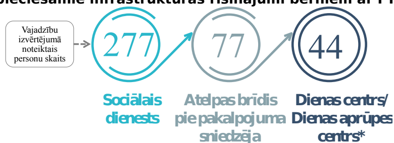
1.attēls. “Nepieciešamie infrastruktūras risinājumi bērniem ar FT ”

Saskaņā ar 277 bērnu izvērtētajām vajadzībām, Kurzemē kopumā “atelpas brīža” pakalpojums pašlaik ir nepieciešama 77 bērniem ar FT un viņu tuviniekiem. Visvairāk - 33 bērnu vecākiem šāds atbalsts nepieciešams Liepājā, 12 - Ventspilī, bet 8 - Kuldīgā. Citās pašvaldībās bērnu un viņu ģimeņu skaits, kam nepieciešams “atelpas brīža” pakalpojums, nepārsniedz pieci. Attēlā Nr.1 redzami Kurzemē nepieciešamie infrastruktūras risinājumi, lai nodrošinātu sabiedrībā balstītus sociālos pakalpojumus bērniem ar FT.